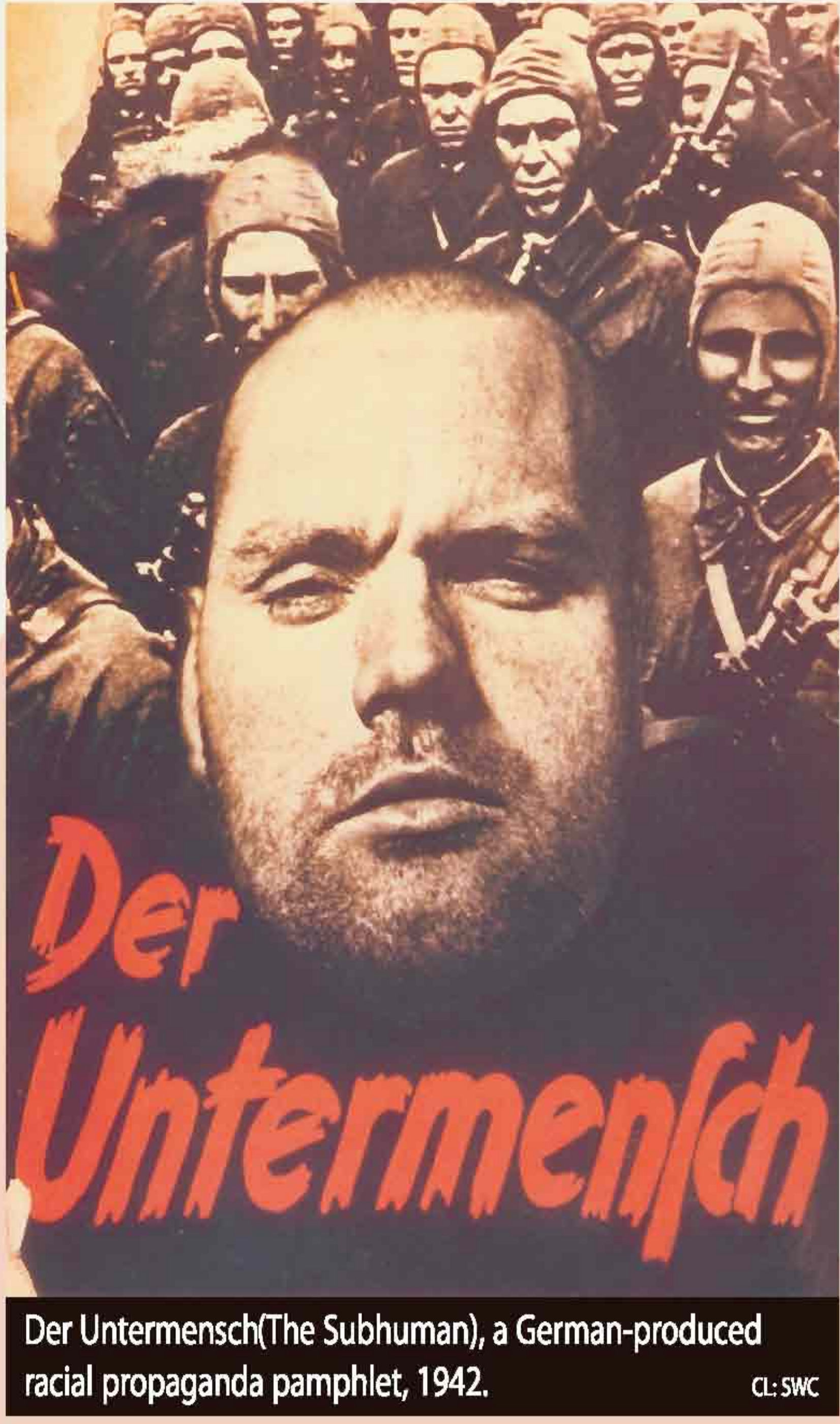
Der Untermensch (The Subhuman), a German-produced racial propaganda pamphlet, 1942.

“Be honest, decent, faithful and congenial towards members of our own blood, but to no one else.” Heinrich Himmler, October 4, 1943