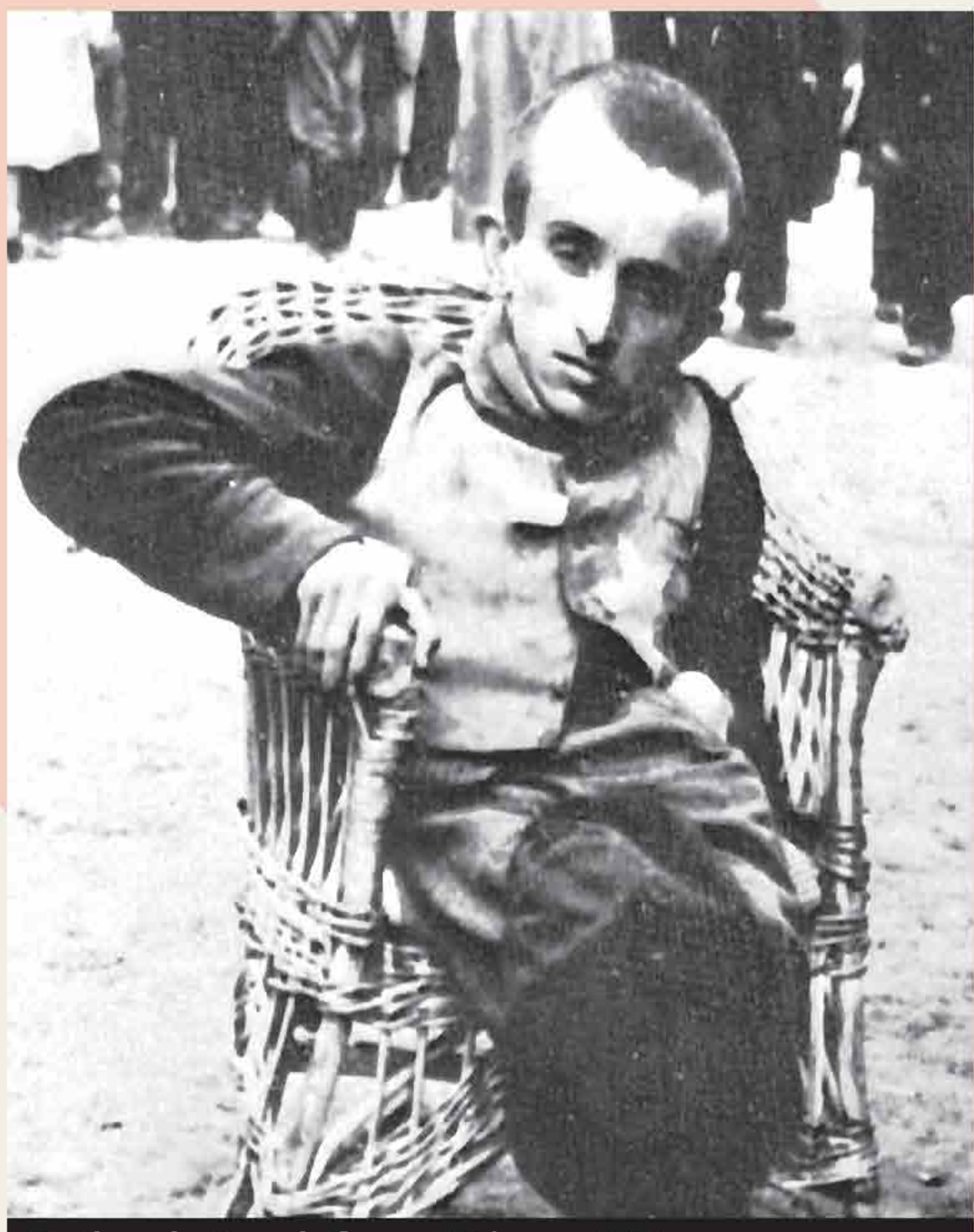
On the selection platform at Birkenau, 1944.

AT THE CORE OF THE NAZI IDEOLOGY WAS A DEADLY VISION OF A racially pure society: a vicious form of social, genetic, and population planning that eliminated every individual not fitting its narrow definition of perfection. While Jews were the primary target, Gypsies, Slavs, homosexuals, the disabled and political dissidents were also trapped in the deadly grip of Nazi ideology.