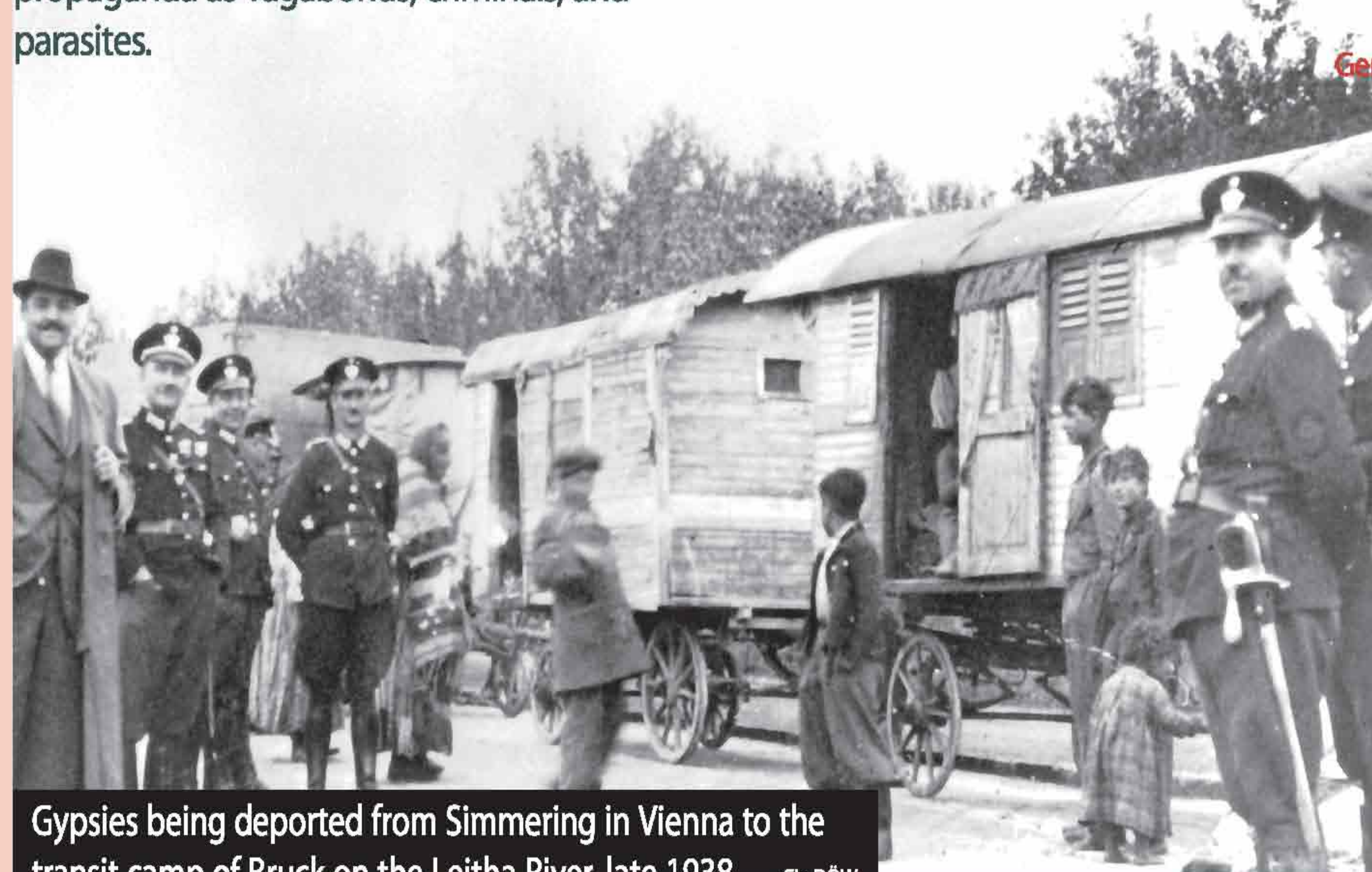
Gypsies being deported from Simmering in Vienna to the transit camp of Bruck on the Leitha River, late 1938.