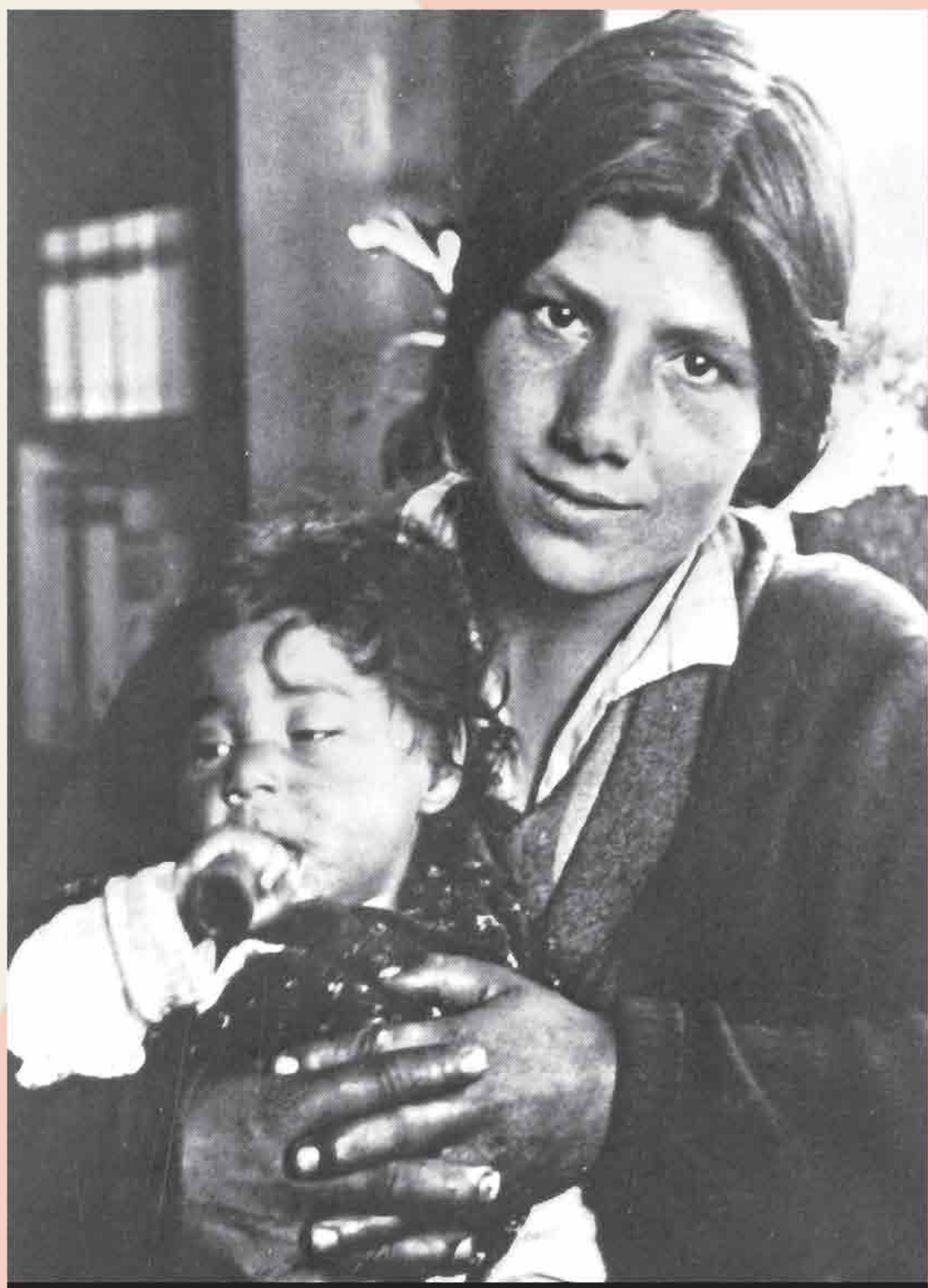
Gypsy mother and child at the Lackenbach transit camp in Burgenland, Austria, 1940.

Stuckart and Globke Commentaries to the German Race Laws, 1936